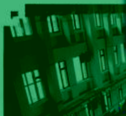
DMC 数控技术 训练场所